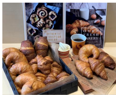
クレイトンズカフェ 提供メニュー ※イメージ

函館市亀田交流プラザは、亀田地区にあった市の5つの公共施設(亀田福祉センター、亀田青少年会館、亀田公民館、美原老人福祉センター、美原児童館)を統合した統合施設です。バリアフリーに配慮し、木を多く取り入れた温かみのある地上1階～3階建の館内には、カフェや図書コーナーを備えた誰もが利用できる「ふれあいホール」、講堂や体育室ほか、子どもや高齢者を対象に無料で開放する活動室などが設置されています。